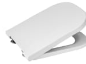
Deska wc Duroplast łatwowyipalna