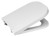
Deska wc Duroplast wolnoopadająca łatwowyipalna